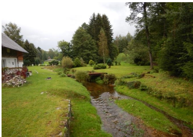
Kritický bod je definován na levostranném přítoku Jeřice (uprostřed)

Místní ohrožení nepůsobí povodí KB definovaného POVISem. Zástavba u ústí drobného toku je na vyvýšeném místě. U ústí se nachází na druhém břehu Jeřice budova, ta je však ohrožována primárně povodněmi ze samotné Jeřice.