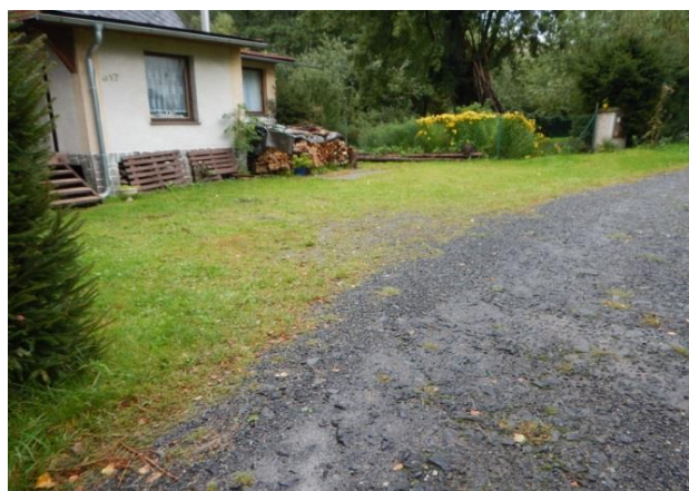
Drobná zástavba podél vlastního ústí přítoku je dostatečně nad terénem